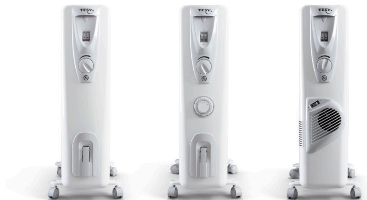
■> E01 R